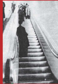
国会議事堂前駅のエスカレーター