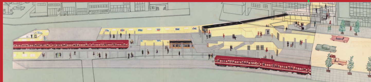
赤坂見附駅断面図