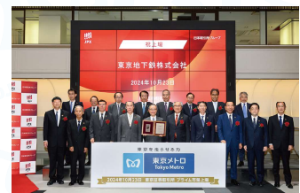
東京証券取引所 プライム市場上場

東京地下鉄株式会社(以下「東京メトロ」)は、特殊会社として2004年4月1日に発足してから、本年で20年を迎えました。これを記念して、地下鉄博物館では、「東京メトロ 20年のあゆみ展」と題した特別展を開催いたします。