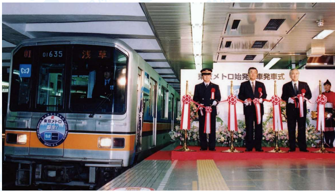
東京メトロ始発列車発車式

今回の特別展では、東京メトロの会社設立後から20年間のあゆみを4つの年代に分けた上で、時代ごとのトピックに焦点をあて、写真パネルや関連する実物資料等により紹介いたします。